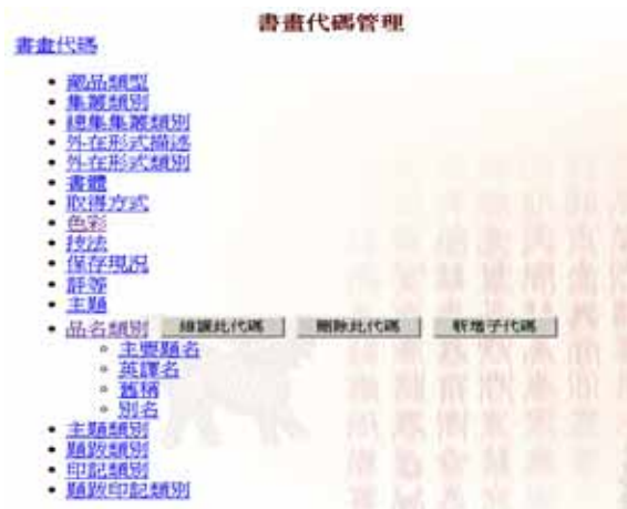
圖表 5 下拉式選單管理

一個完整的資訊系統必需提供相關管理系統的工具，使系統能夠有效的被管理。因此本系統提供基本的權限管理、日誌管理與代碼管理的功能，權限管理系統提供管理存取本系統的相關人員資訊，以確保系統運作的安全。日誌管理則是提供系統運作過程中相關重要資訊的記錄功能，以做為日後系統稽核時的依據。在書畫藏品資料中有許多的著錄項目，由於資料內容有限，若讓使用者輸入資料，不但沒有效率且資料容易輸入錯誤，因此在本系統中採用下拉式選單做為資料的輸入方式，並將選項內容存放在資料庫內，以方便系統的維護。代碼管理便是書畫典藏資料庫選項內容的維護界面，透過樹狀結構逐層展開選項內容，使系統管理人員得以新增、修改或刪除一個選項代碼，而在此所做的任何變更都將直接反應到書畫典藏資料庫內，以保持雙方資料的一致性。